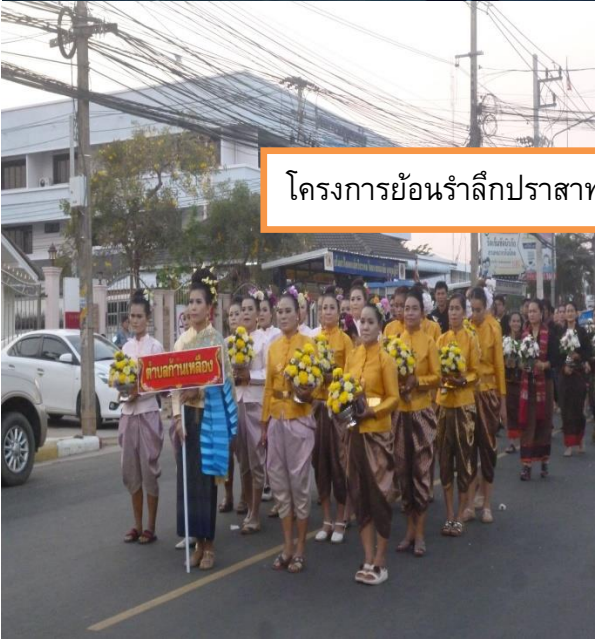
โครงการย้อนรำลึกปราสาทสระกำแพงใหญ่ ขึ้น 2 ค่ำ เดือน