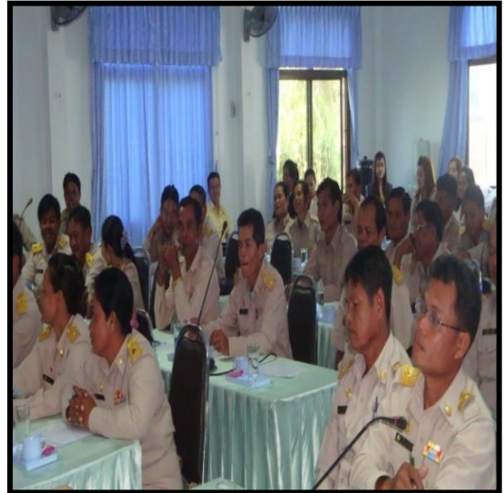
การประชุมสภาองค์การบริหารส่วนตำบล