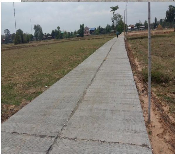
ปรับปรุงถนนคอนกรีตเสริมเหล็ก บ้านหัวช้าง หมู่ที่ 19