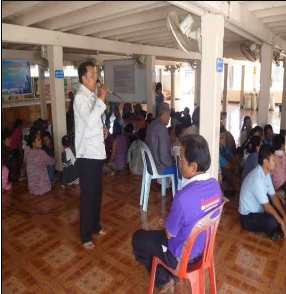
โครงการประชุมประชาคมเพื่อจัดทำแผนพัฒนา