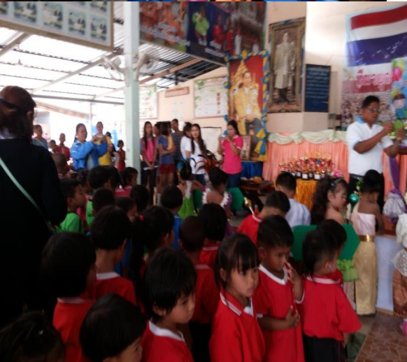
โครงการจัดงานวันเด็กแห่งชาติ