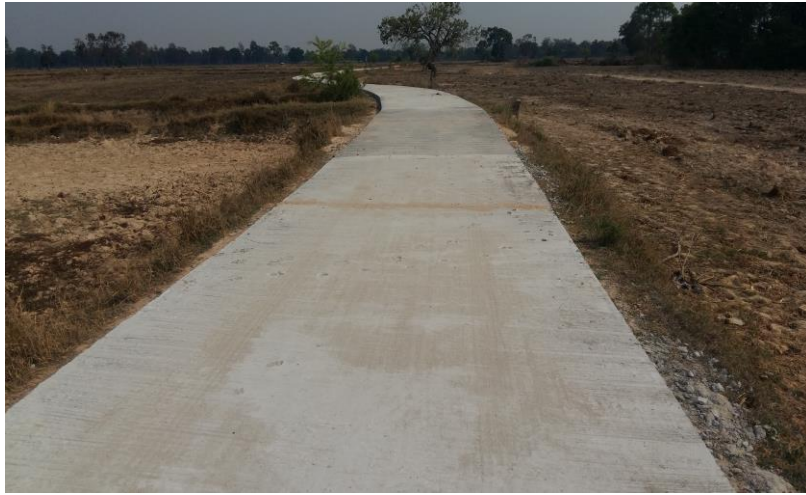
ปรับปรุงถนนคอนกรีตเสริมเหล็ก บ้านหัวหนอง หมู่ที่ 16