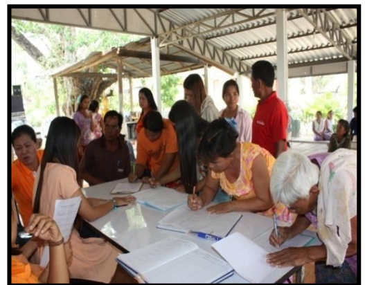
โครงการแจกเบี้ยยังชีพผู้สูงอายุ ผู้พิการ และผู้ติดเชื้อเอ็ดส์