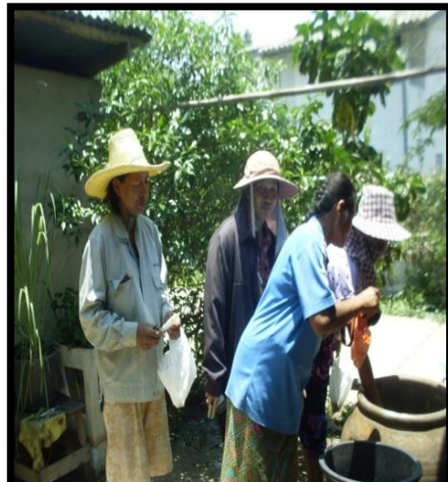
โครงการตรวจลูกน้ำยุงลายและกำจัดยุงลาย